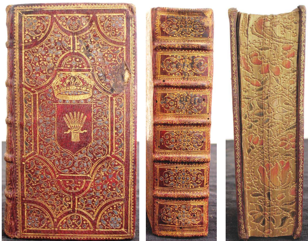
Piacenza, Biblioteca civica Passerini, (L)F 3 .II.59.