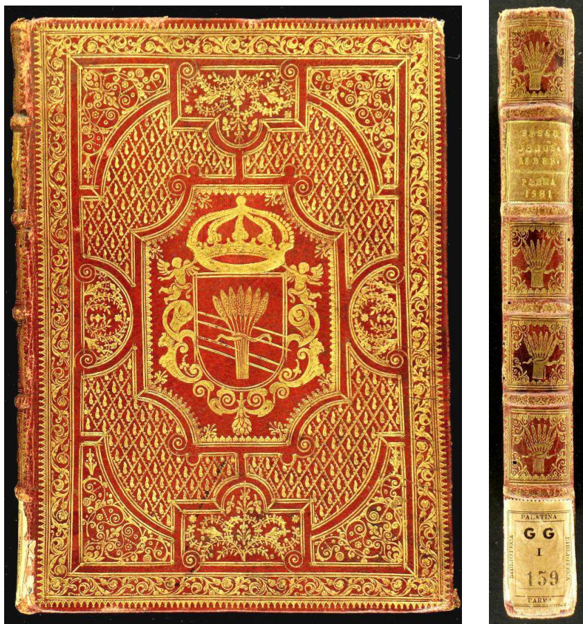
Parma, Biblioteca Palatina, GG.I.159.