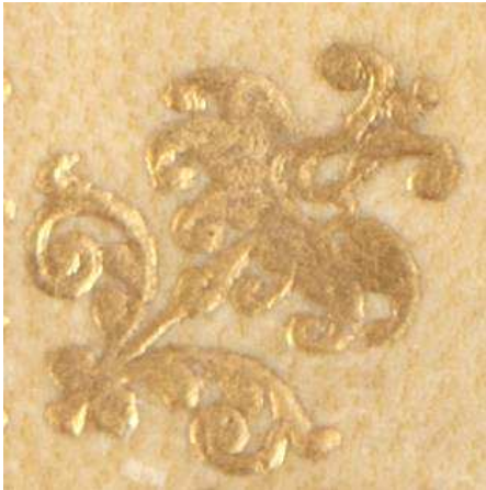
8 D 78, particolare.