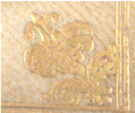
8 B 456, particolare.