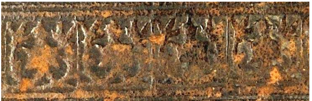
Verona, Biblioteca civica, Inc. 560, dettaglio. Fregio incluso nel CLEM. ramo d'edera.