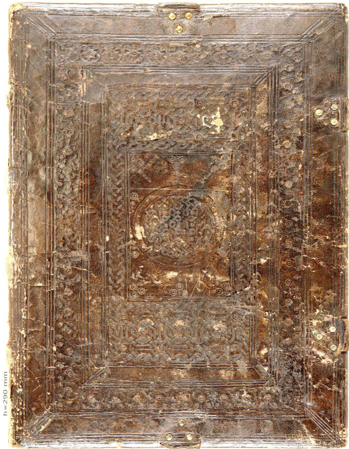
Milano, Biblioteca Braidense, Marcus Annaeus Lucanus, Pharsalia (in volgare), ms. membr., sec. XV.