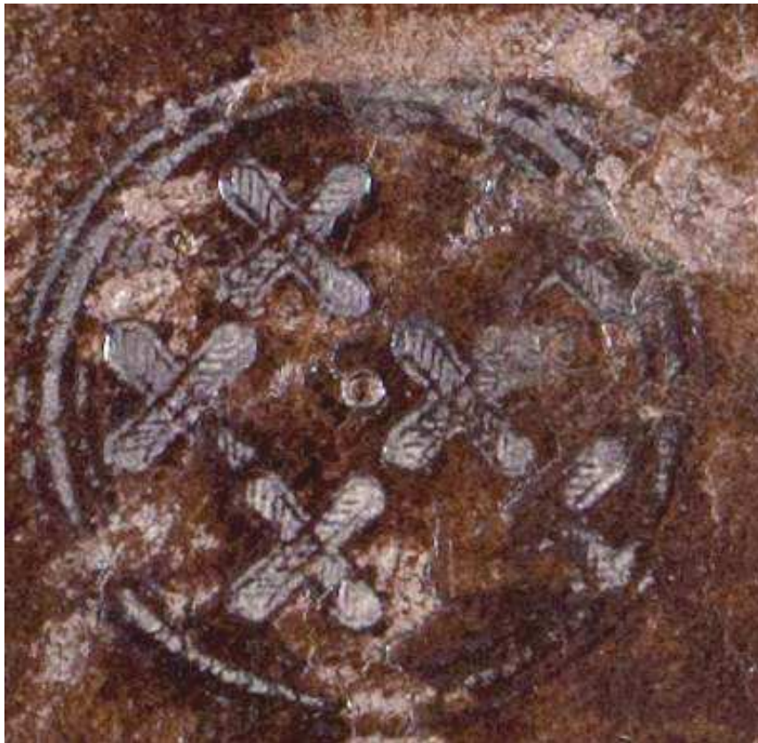
Mss. Vari D 19, particolare. Cfr. HOBSON 1989, p. 19.