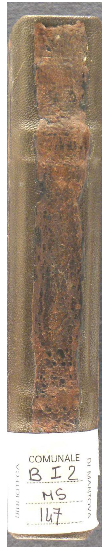
Mantova, Biblioteca Teresiana Ms. 147, Sermoni e racconti agiografici del convento di S. Paola di Mantova , ms. membranaceo sec. XV (1483) - XVII, cc. 117.