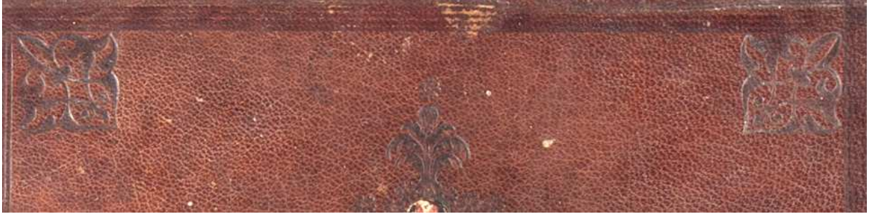
Mss. Vari A 62, particolare. Cfr. infra .