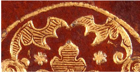
Mss. Regg. F 269, particolare.