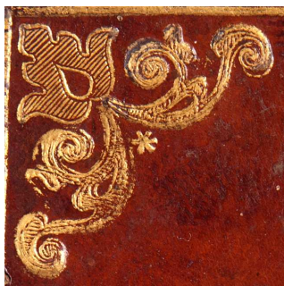
Mss. Regg. F 269, particolare.

Cfr. BIBLIOTECA MUSEO CORRER VENEZIA 2007, n. 63, Fraterna di cento sacerdoti dei santi Giovanni e Paolo in Santo Stefano di Murano , ms. sec. XVI.XVIII (1532, 1534-1766), p. 224, n. 63 5-6. Motivo presente anche in legature seicentesche opera della bottega vaticana Andreoli.