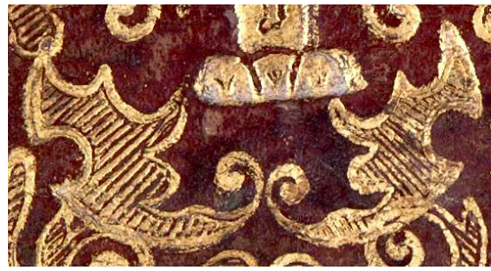
13 K 518, particolare.