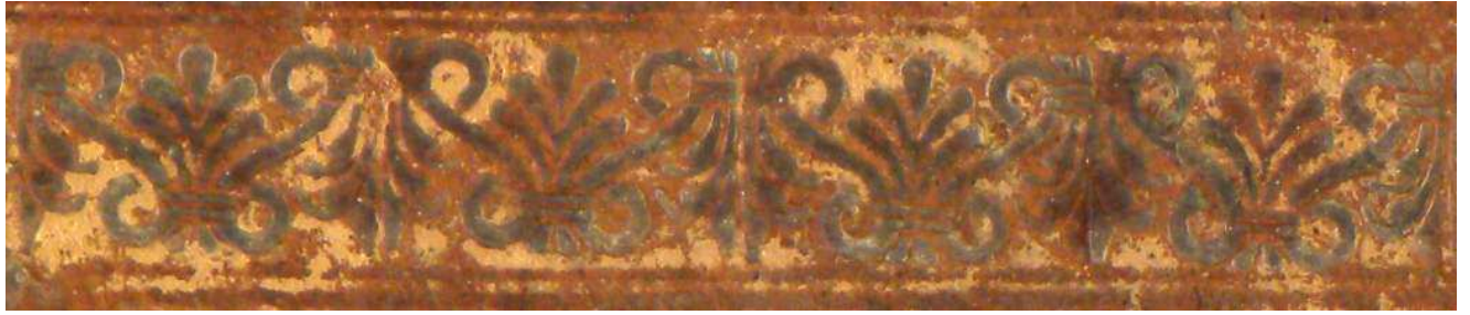
Mantova, Biblioteca Teresiana, Ms. 506, particolare.