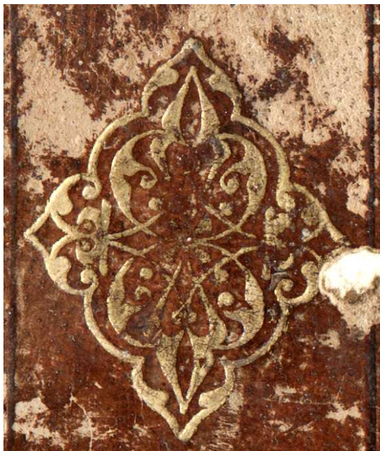
Ed. Ald. D 8, particolare. Cfr. Aldine E 2, Aldine E 8; DE MARINIS 1960, II, n. 1795, tav. CCCXLII, . Venezia, Museo Correr, 61, Commissione per Giovanni Mauro , 1508.