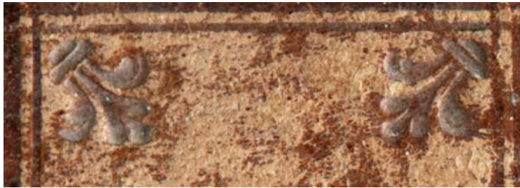
Ed. Ald. D 8, particolare. Cfr. DE MARINIS 1960, II, n.1693, tav. CCCXVIII, raccolta De Marinis, Cartellina per contenere fogli musicali , Firenze. Motivo ripreso anche in legature romane del secondo quarto del secolo XVI ad opera del legatore vaticano Mastro Luigi (DE MARINIS 1960, II, Firenze, Biblioteca Ricardiana, ed. rare 251, n. 2030, tav. CCCLXV, G. Pontano , Venezia, 1518).