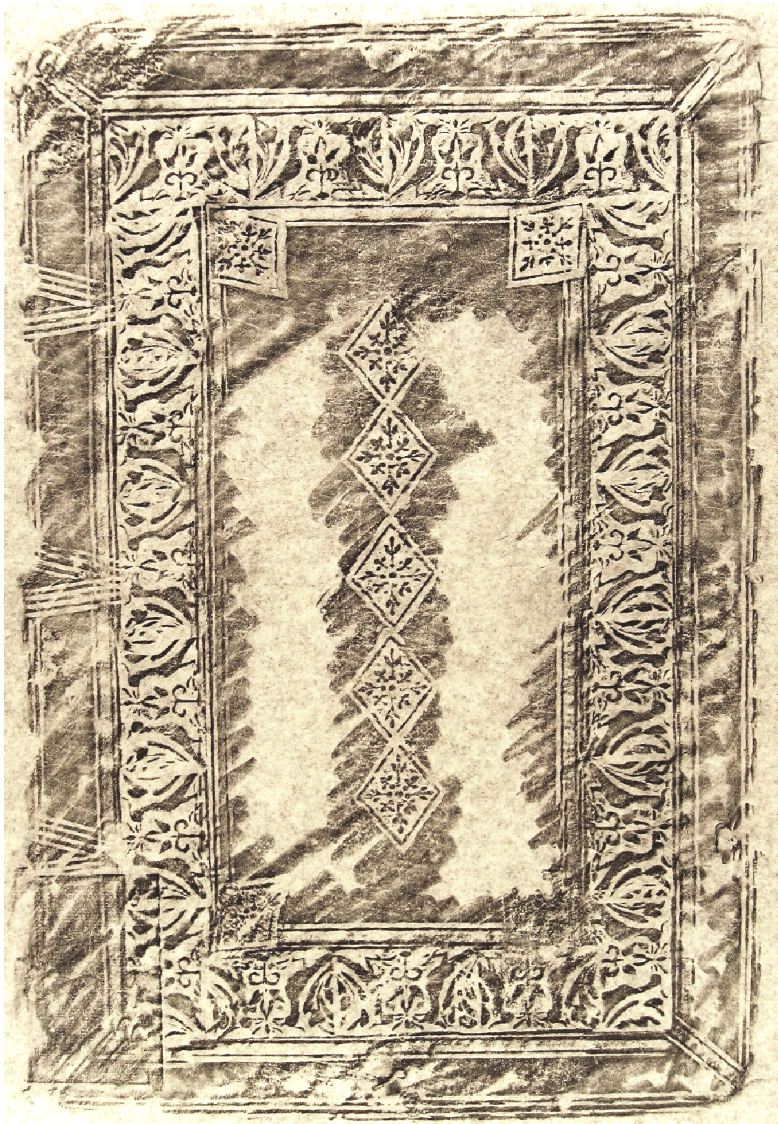
Brescia, Biblioteca Queriniana, Cinquecentine EE 2, Sphera volgare novamente tradotta , Venezia, Bartolomeo Zanetti, 1537.