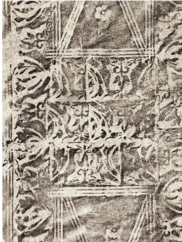
Brescia, Biblioteca Queriniana, Cinquecentine C 91.