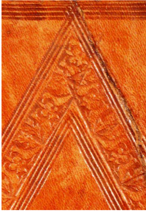
Bergamo, Biblioteca civica A. Mai, MIA 911, dettaglio.