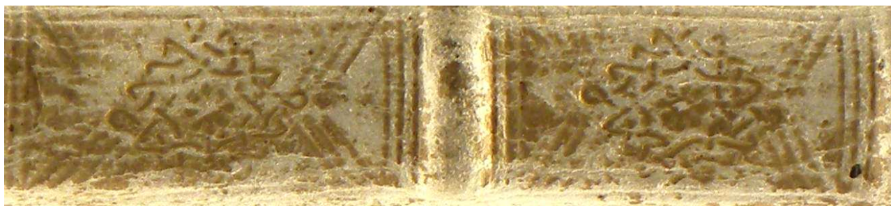
Inc. 1173, dettaglio.