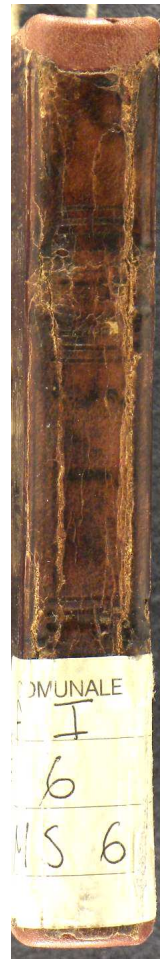
Mantova, Biblioteca Teresiana, Ms. 6, Trattati sulla Reliquia del Preziosissimo Sangue , ms. cartaceo sec. XVI, metà, cc. 112.