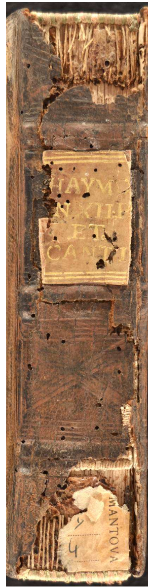
Mantova, Biblioteca Teresiana, m.III.24, Haimo : Halberstadensis, Haymonis episcopi Halberstattensis In 12. prophetas minores enarratio. Eiusdem in Cantica canticorum commentarius disertissimus , Coloniae : ex officina Eucharij Ceruicorni, 1533 (Coloniae : apud Eucharium Ceruicornum : procurante M. Godefrido Hittorpio ..., 1533). Genere di decoro incluso nel CLEM.