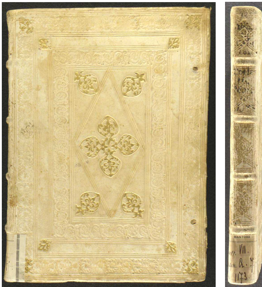
Mantova, Biblioteca Teresiana, Inc. 1173, Alfonso X (re di Castiglia), Tabulae astronomicae , [Venezia], Erhard Ratdolt, 1483.