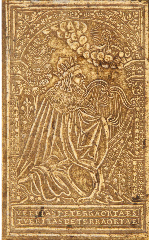
17 H 512, particolare.

EBDB p002886, EBDB w004452. Bottega München ESIg/A.gr.a.1054-1*: Esempio: München, Bayerische Staatsbibliothek: ESIg/A.gr.a. 1054-1, Homerus, Ilias , Strassburg, Theodosius Rihel, 1592.