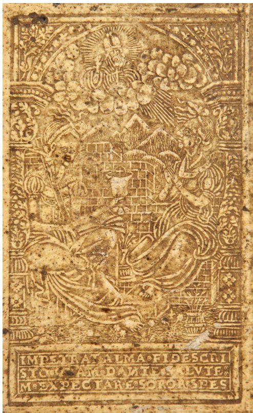
17 H 512, particolare.