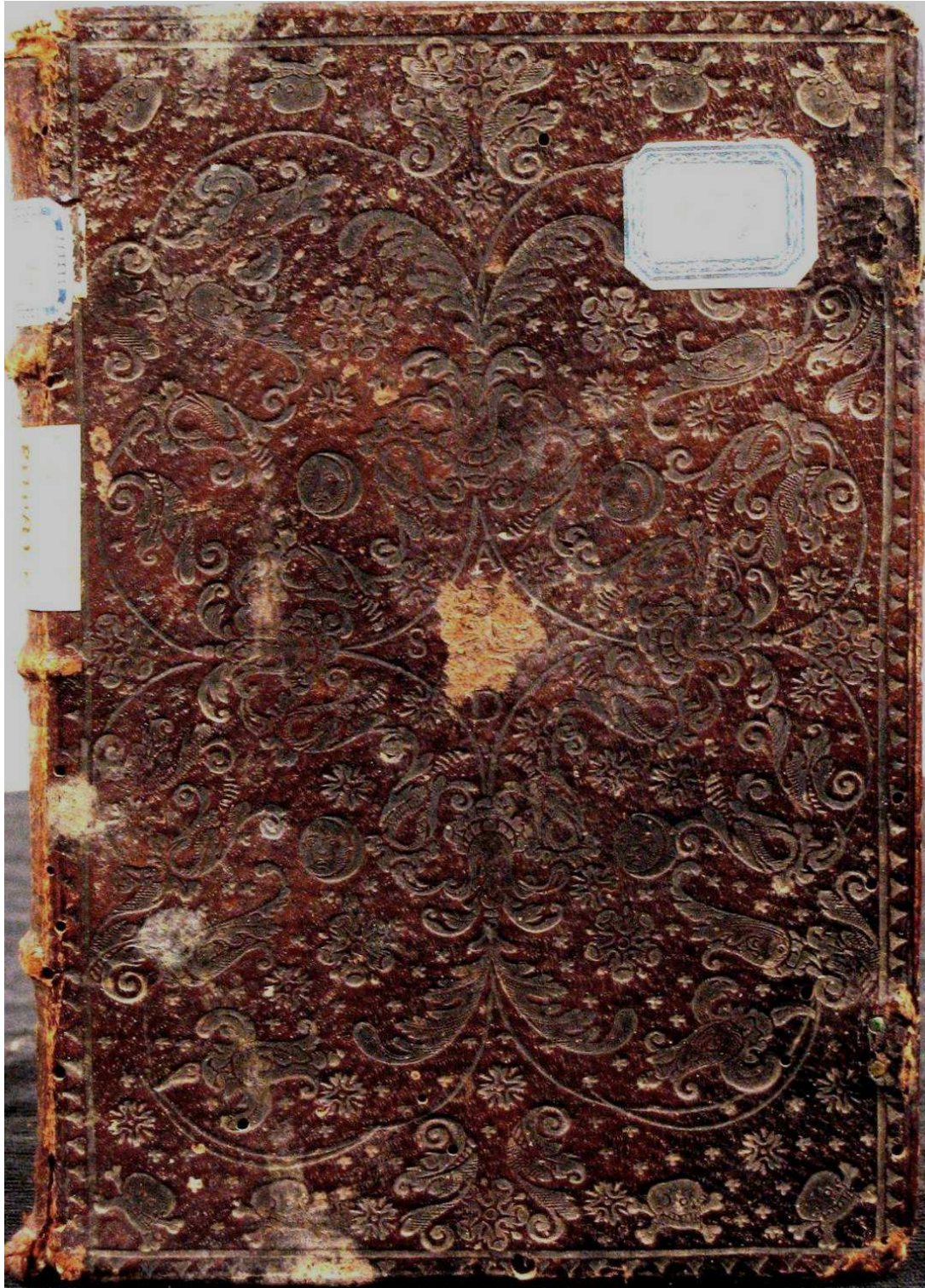
Piacenza, Biblioteca civica Passerini Landi, Ms. Pallastrelli 196, Ordo recipiendi Mulierem ad ordinem beati Augustini doctoris eximii..... , sec. XV (1490), ms. cartaceo cc. 41 numerate.