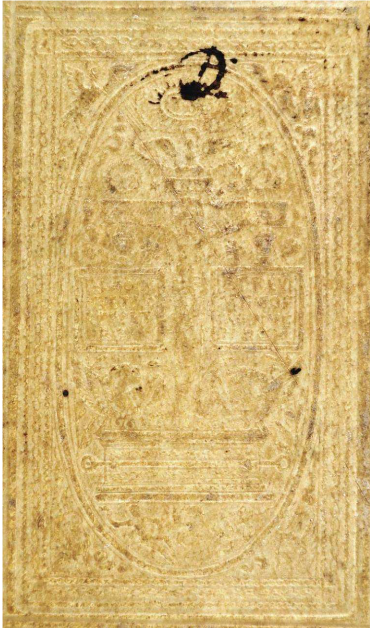
Mantova, Biblioteca Teresiana, 12.B.37, particolare.