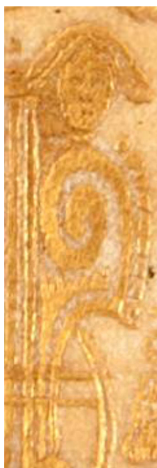
15 E 164, particolare.

15 E 164, particolare. Cfr. BIBLIOTECA CASANATENSE ROMA 1995,I, n. 779, II, fig. 330, f.X.5, Stellandt, Tommaso Gaetano, Documenti politici... , Roma, Nella Stampa di Giuseppe Vannacci, 1690.