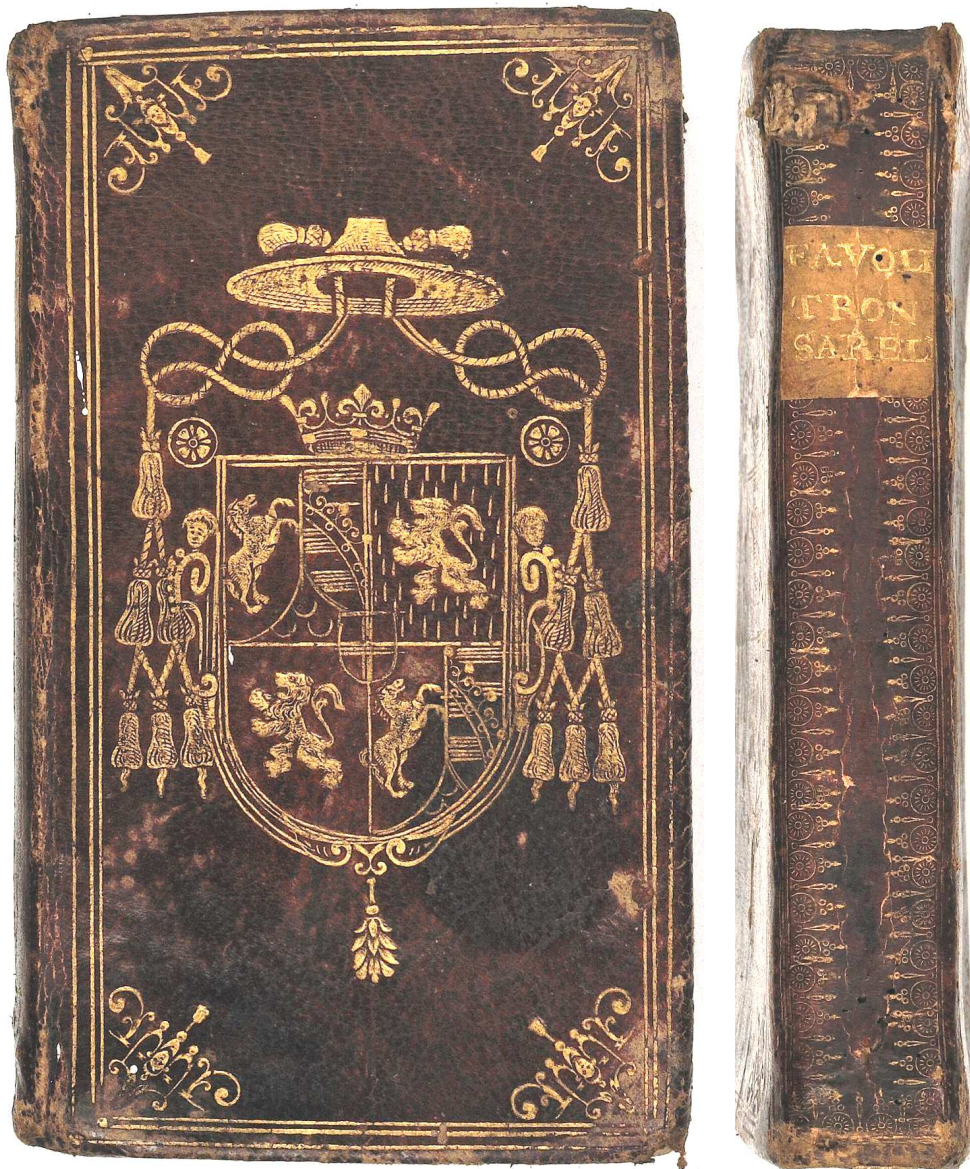
Verona, Biblioteca civica, 336.3.