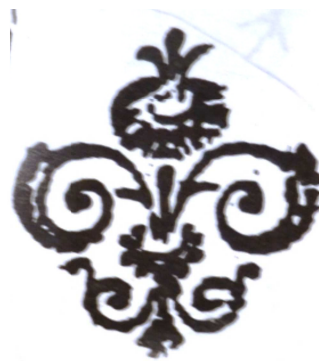
VIANINI TOLOMEI 1991, tavola IV.