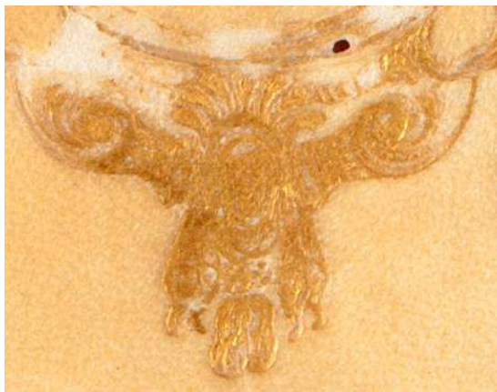
15 E 164, particolare. Cfr. BIBLIOTECA CASANATENSE ROMA 1995, I, n. 741, II, fig. 304, e.IV.15, Cabedo, Jorge de, De patronatibus Ecclesiarum regiae coronae regni Lusitaniae liber unus , Olisipone, Ex Officina Georgij Rodriguez, 1602.