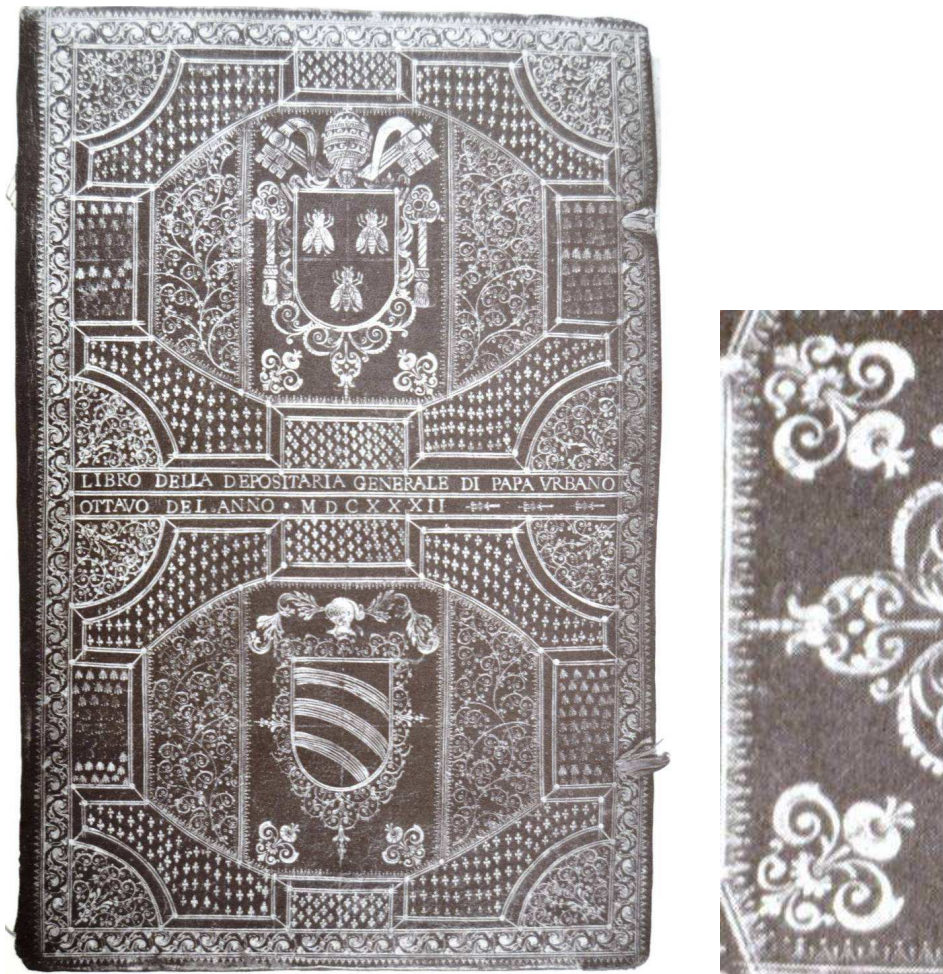
LEGATURA ROMANA BAROCCA 1991, p. 100, n. 36, Registro della Depositeria Generale , ms cartaceo sec. XVII (1632), Roma, Archivio Sacchetti.