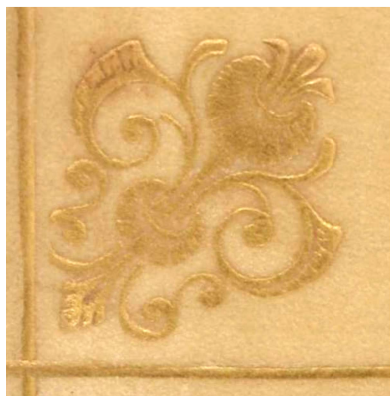
LII.D.6 I, dettaglio.