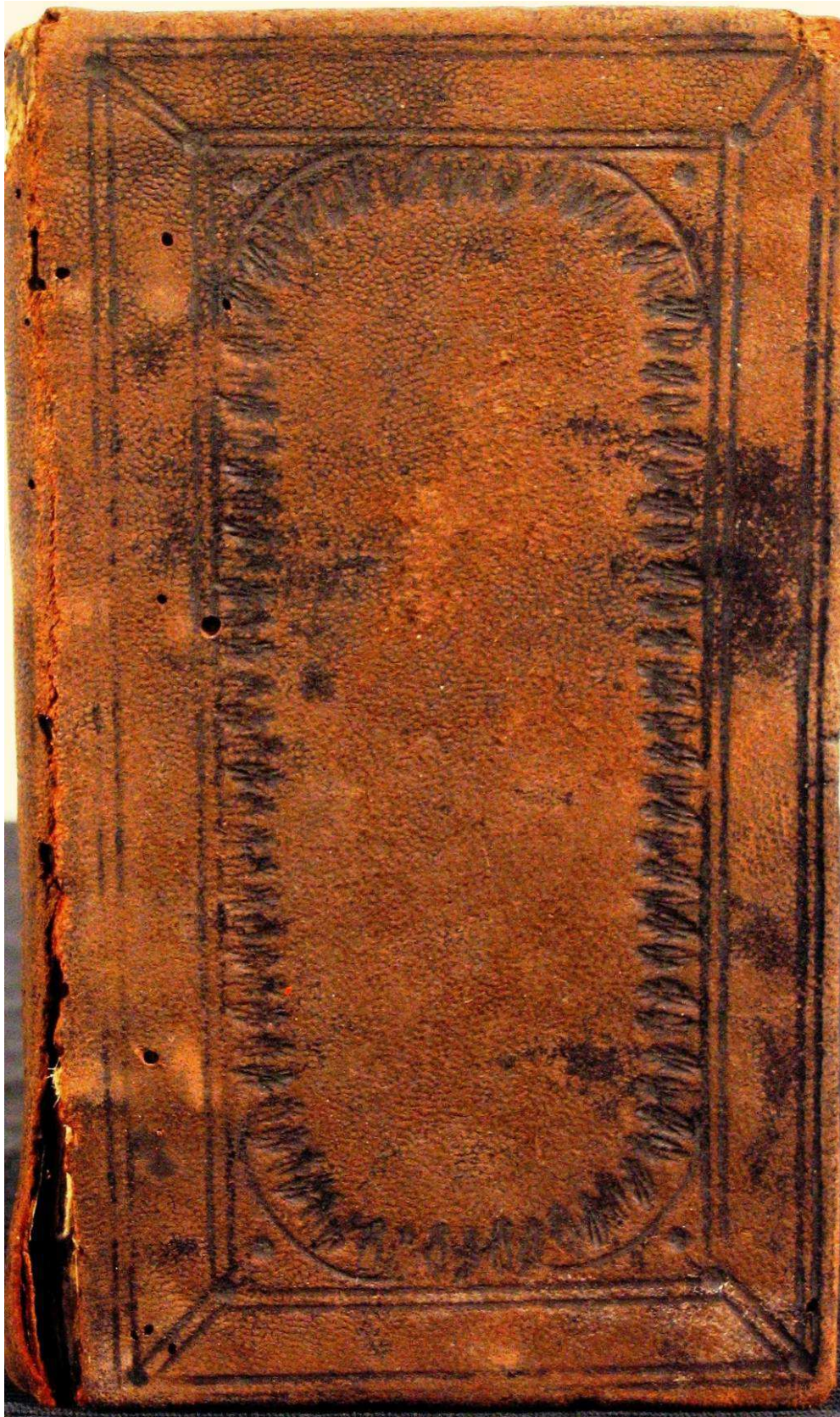
Piacenza, Biblioteca civica Passerini Landi, (L)M.X.32.