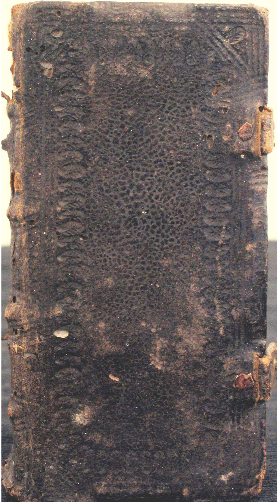
Piacenza, Biblioteca civica Passerini Landi, (C)Anguissola 8.