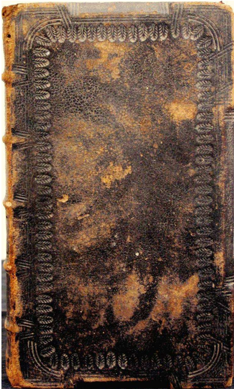
Piacenza, Biblioteca civica Passerini Landi, (C)7A.XI.11.