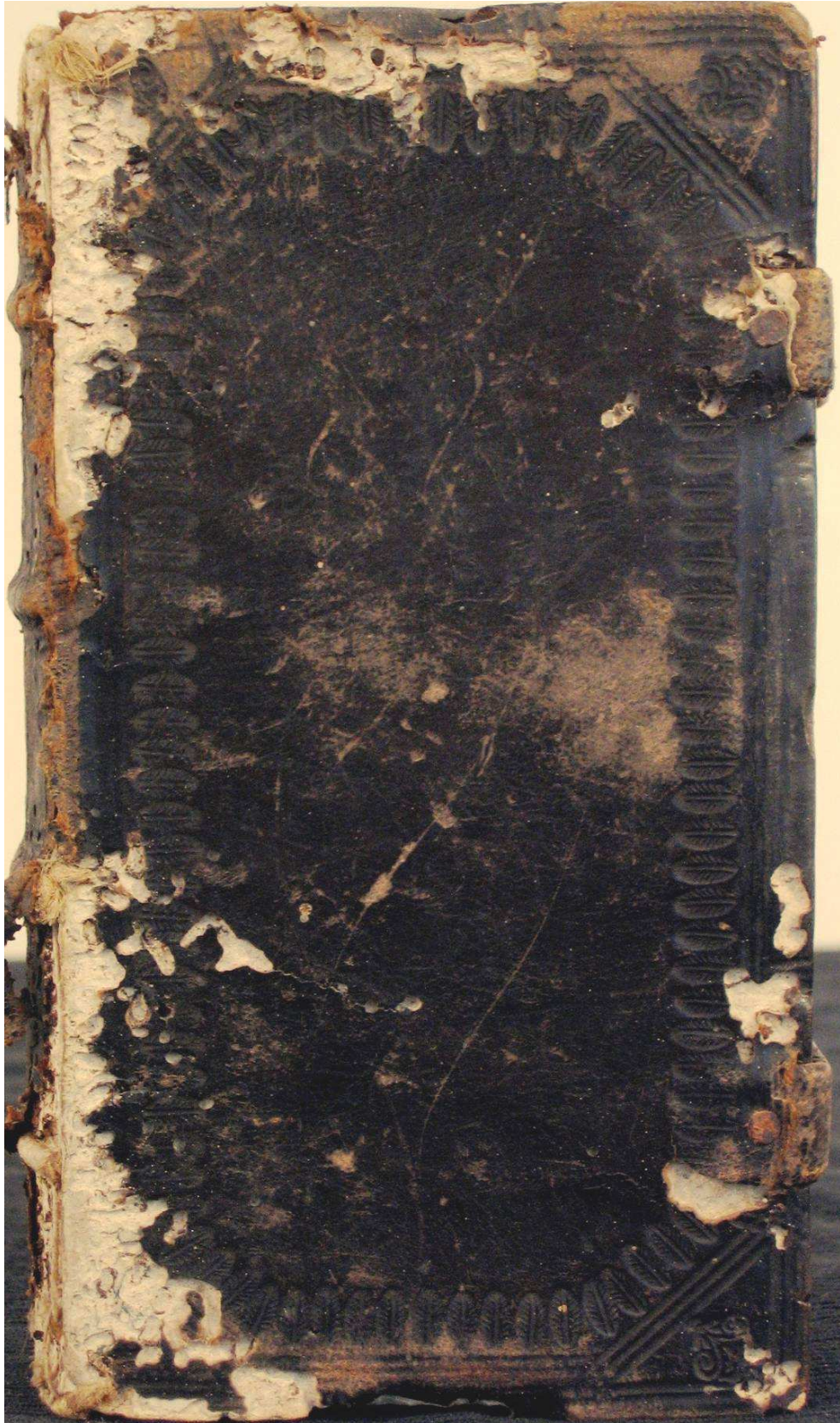
Piacenza, Biblioteca civica Passerini Landi, (C)Anguissola 9.