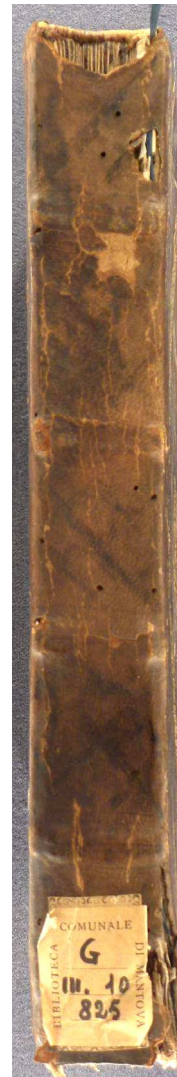
Mantova, Biblioteca Teresiana, Ms. 825