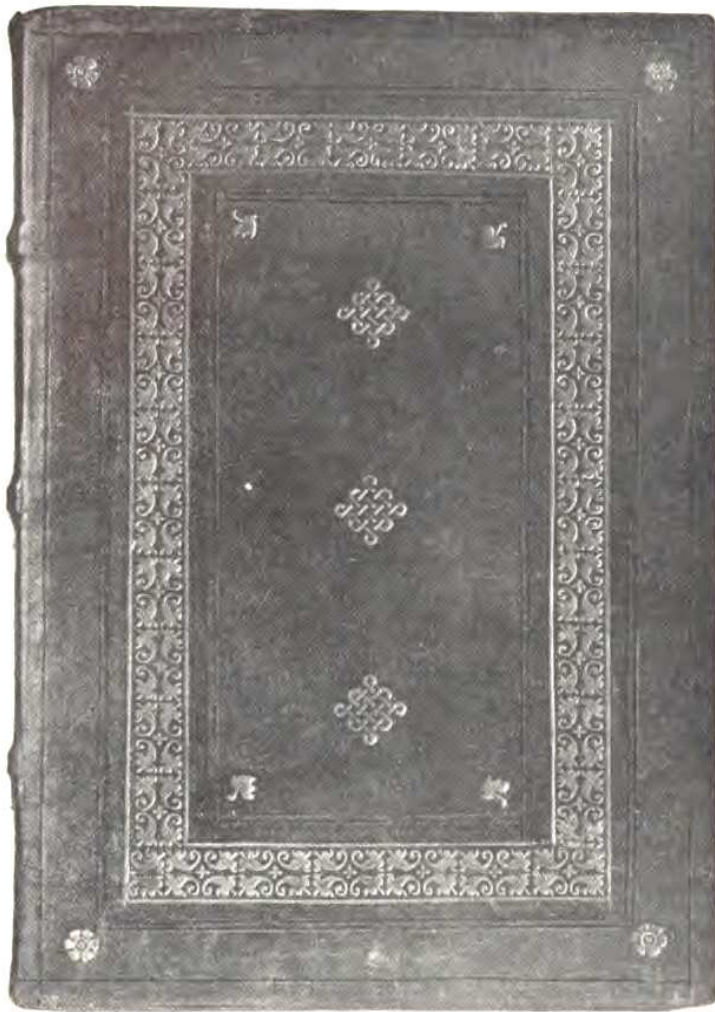
HANNOVER 1907, n. 25.